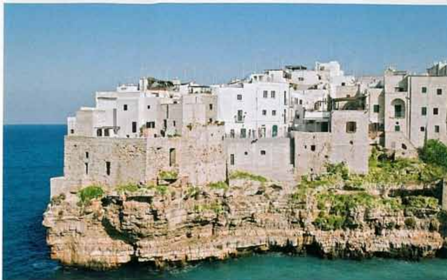
Hübsche Lage: Polignano a Mare ist auf Fels gebaut, aus dem Meer kommen die Muscheln frisch ins Restaurant Da Tuccino